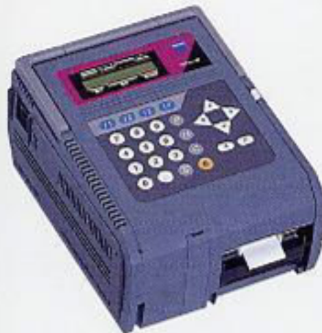
スタンドアロンタイプ