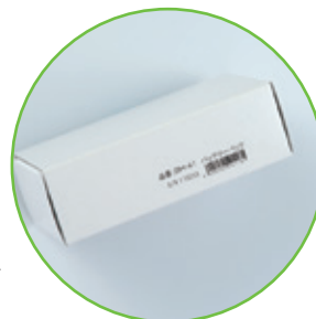
組立前のパッケージに