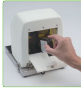
レバーを外して カートリッジを取り出す