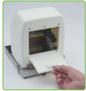
本体背面のカバーを開く