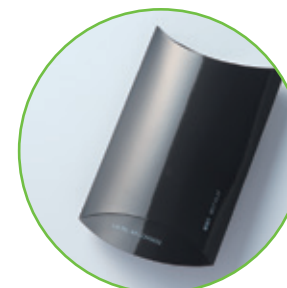
黒色でコーティングされた素材にも