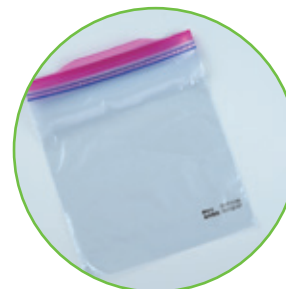
透明なプラスチック素材に