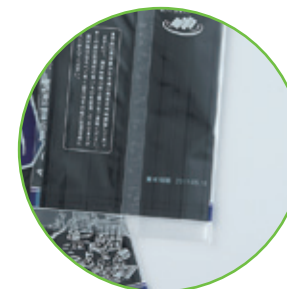
透明で中身が濃い色には白インクで ※白インクは現在開発中です。