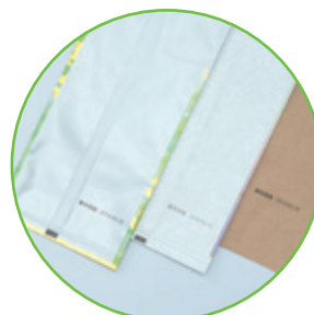
雲龍紙、クラフト紙などの封筒に

アルミ、クラフト紙、和紙(雲竜紙)、フィルムなど、多様な素材にひとつのインクカートリッジでキレイに印字できます。 いろんなシーンで用途が広がります。