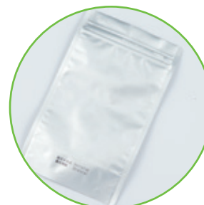
アルミ素材のパッケージにも