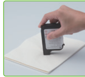
万一目詰まりしたときは クリーニングペーパーで 拭き取るだけ